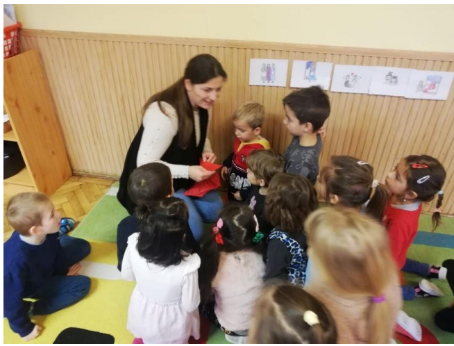
(Mikuláshét- Szent Miklós legendája)

Az anyanyelvi nevelés minden tevékenységben megvalósult. A gyermekek az adott témahetekhez kapcsolódóan rengeteg verssel, mondókával, mesével, dallal ismerkedtek meg. A heti témákkal, kapcsolatos ismeretekkel a Természet-Társadalom-Ember tevékenység keretein belül ismerkedtek meg a gyermekek hét elején, majd erre építettük a többi tevékenységet (Művészeti tevékenység – Rajzolás, festés, mintázás, kézimunka, Matematikai tapasztalatok, Művészeti tevékenység- Ének, zene, énekes játék, gyermektánc, Testnevelés). A Mese-Vers tevékenységek naponta ismétlődtek. A hetet mindig a tudás beépülésének ellenőrzésével zártuk beszélgetések formájában, ezzel is fejlesztve a gyermekek kommunikációs-és nyelvi készségét, kognitív készségét.