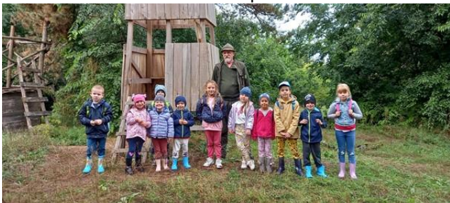
(Kirándulás az Ölbői erdőben a középső-és nagycsoportos gyermekekkel)