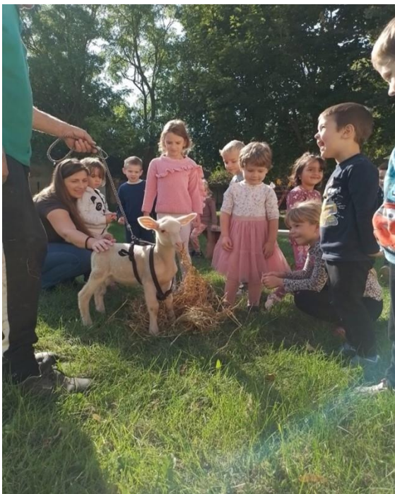
(Mucika látogatása az ovisoknál a Mihály-napi héten)

Intézményünk számára kiemelten fontos a hagyományápolás. A magyar hagyományok, ünnepek, jeles napok és a helyi szokások nagymértékben meghatározták a nevelési év tartalmát, témáit, melyek köré, változatos tevékenységeket szerveztük. Ilyenek voltak többek között Mihály nap, a magyar népmese napja, Márton nap, Mikulás, Advent, Luca nap, Karácsony, Medvenap, Farsang, Március 15., Víz világnapja, Húsvét, Föld napja, Anyák napja, Évzáró és a nagycsoportosok búcsúztatása, valamint a családi nap, amit az önkormányzat anyagi hozzájárulásával, a szülők, a szülői munkaközösség és egyéb támogatók felajánlásaival, támogatásával valósítottunk meg.