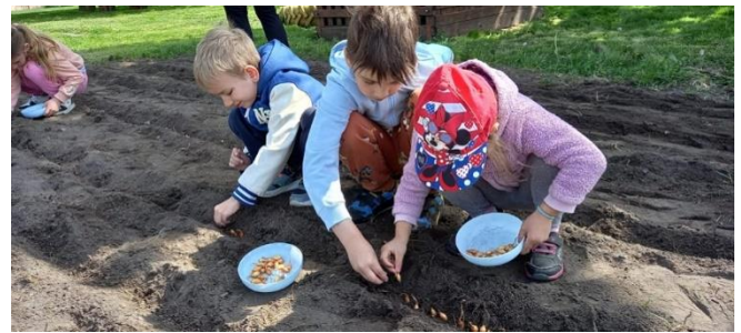
(A Föld napja témahét – Veteményezés – munkajellegű tevékenység)