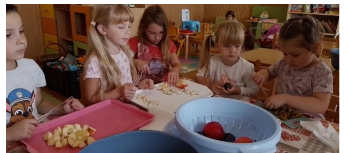
(Az ősz kincsei – Gyümölcsök témahét - gyümölcssaláta készítése)