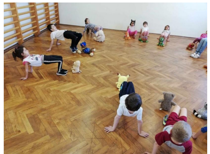
(Foglalkozások, mesterségek hete - plüssös torna)

Nagy hangsúlyt fektettünk a gyermekek mozgásigényének kielégítésére, lehetőség szerint minél több időt töltöttünk a szabadban. Heti egy alkalommal szervezett mozgásos tevékenységet tartottunk a tornateremben, ha az időjárás engedte az udvaron, melynek során a gyermekek nagymozgását, koordinációs képességeit, egyensúlyérzékét, erőnlétét, téri tájékozódását fejlesztettük. Ezen felül a tízórai előtt mindennapos játékos mozgást végeztünk mondókák, dalok segítségével. A gyermekeket egyéni képességeik figyelembevételével ösztönöztük az önálló tisztálkodásra, öltözködéssre. Szerencsére a bőnyi konyha bőkezűen ellátott minket gyümölcscsel, így nem volt szükség külön gyümölcsnap bevezetésére. Az egészséges életmóddal kapcsolatos ismeretek a következő témákon keresztül jelentek meg kiemelten: „Az ősz kincsei- Gyümölcsök”, „Az én testem”, „Egészség hét- Egészségünk védelme”.