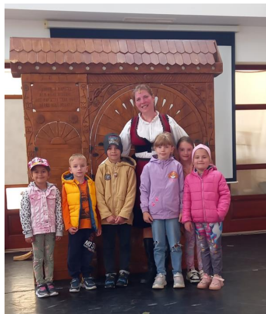
(Nagycsoportos gyermekeink a Magyar Műhely Általános Művelődési Központ bábelőadásán, Mezőörsön)

Az iskolákkal való kapcsolatunk szorosabbra fűződött az elmúlt évekhez képest. A környező intézmények mindegyikével folyamatos volt a kapcsolattartás. Rendezvényekre, iskolacsalogató foglalkozásra invitálták a nagycsoportos óvodásokat.